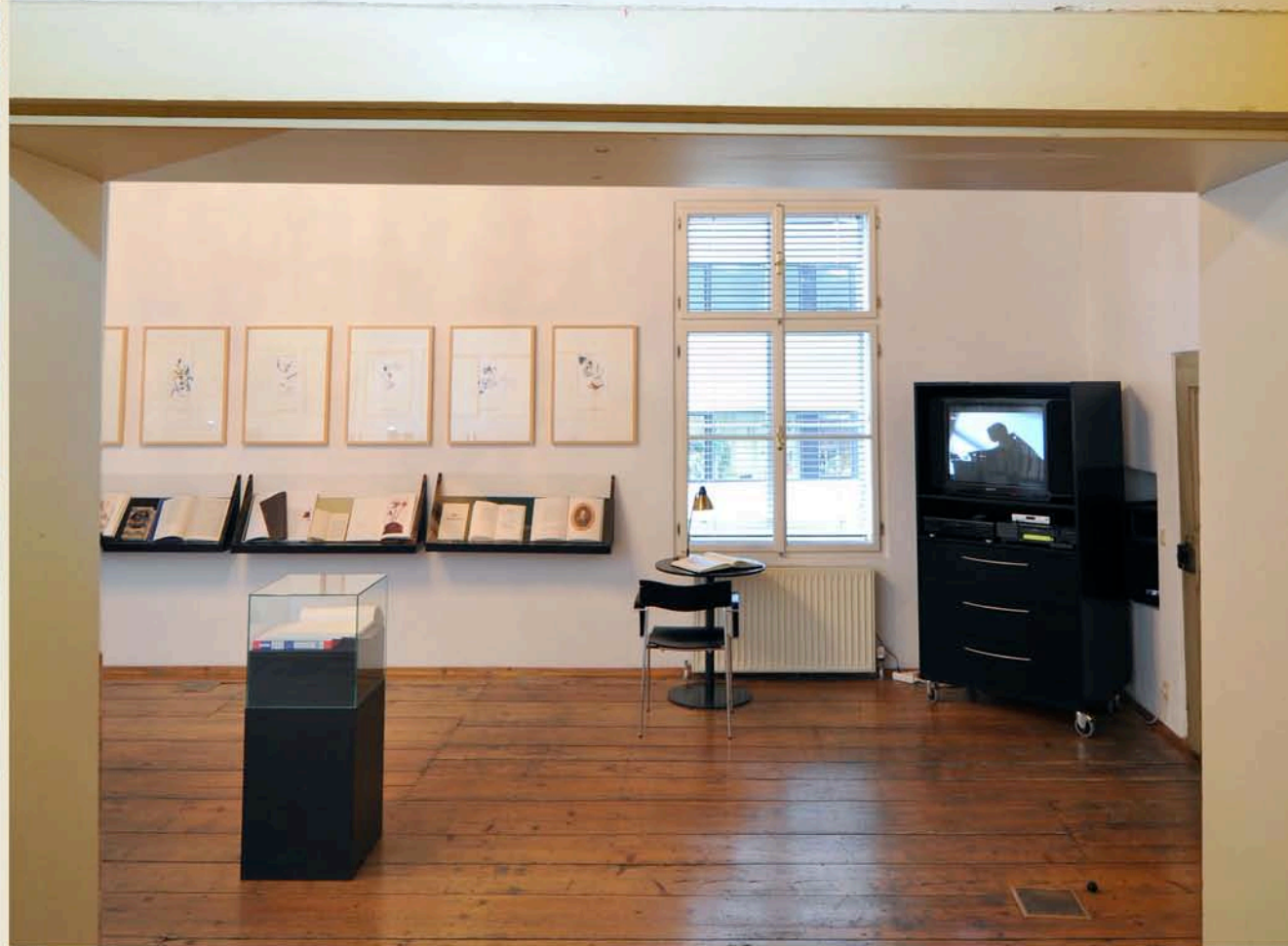
AUSSTELLUNGS- & SEMINARRAUM: 52 qm (Breite 5,7 m, Länge 9,3 m, Höhe 4,5 m)